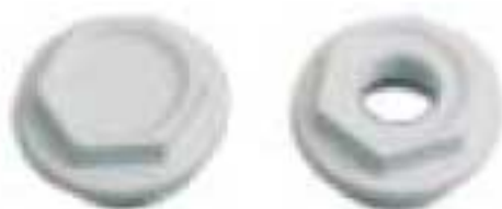
5 - Пробка глухая на 1" или проходная с редукцией белая