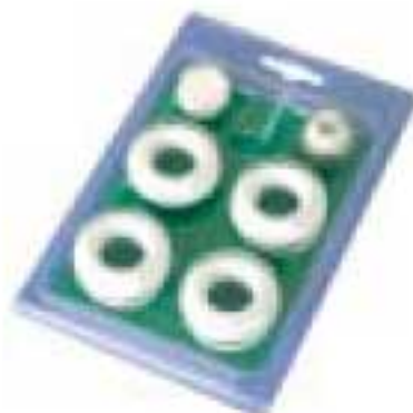
43 - Комплект монтажный на 3/8" с силиконовыми прокладками для радиаторов высотой от 200/D до 800 мм