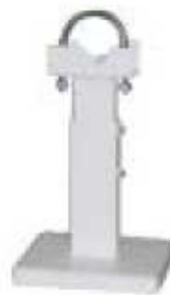
15 - Кронштейн напольный белый