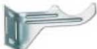
3 - Кронштейн угловой оцинкованный