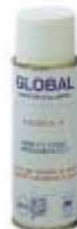
10 - Краска в аэрозольном баллончике