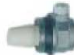
13 - Автоматический клапан спуска воздуха на 1"