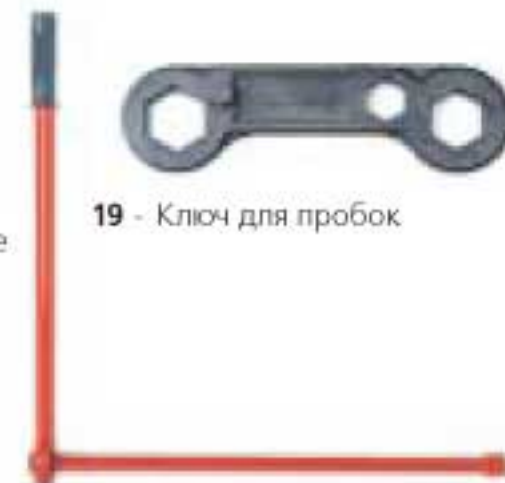
19 - Ключ для пробок