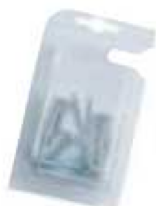
29 - Кронштейны угловые белые Blister (пара)