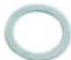
7 - Прокладка для пробки 1,50 мм