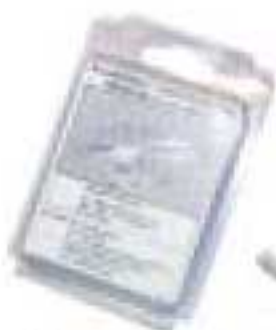
27 - Кронштейны универсальные белые Blister (пара)