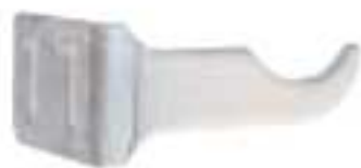
4 - Кронштейн угловой белый пластифицированный