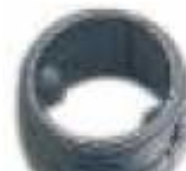
9 - Ниппель 1"