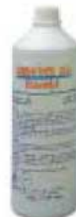
18 - Жидкость Cillit Combi