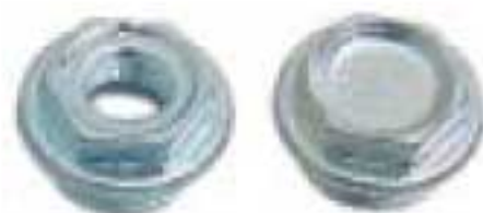
6 - Пробка глухая на 1" или проходная с редукцией оцинкованная