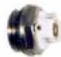
41 - Ручной клапан спуска воздуха на 1/2"