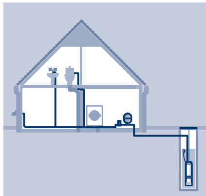
Типовой погружной вариант монтажа насоса Grundfos SPO с сетчатым фильтром на всасывании